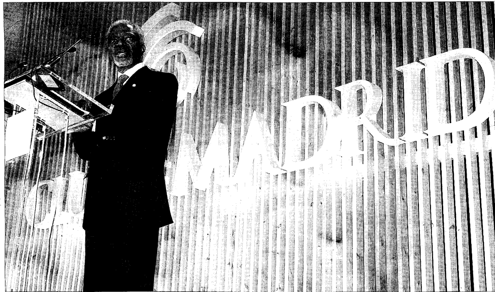
El secretario general de Naciones Unidas, Kofi Annan, durante su intervención en la Cumbre Internacional sobre Democracia, Terrorismo y Seguridad de Madrid.

El secretario general de Naciones Unidas reconoce que esta organización debe estar a la vanguardia mundial para hacer frente «a la mayor amenaza mundial de este siglo»